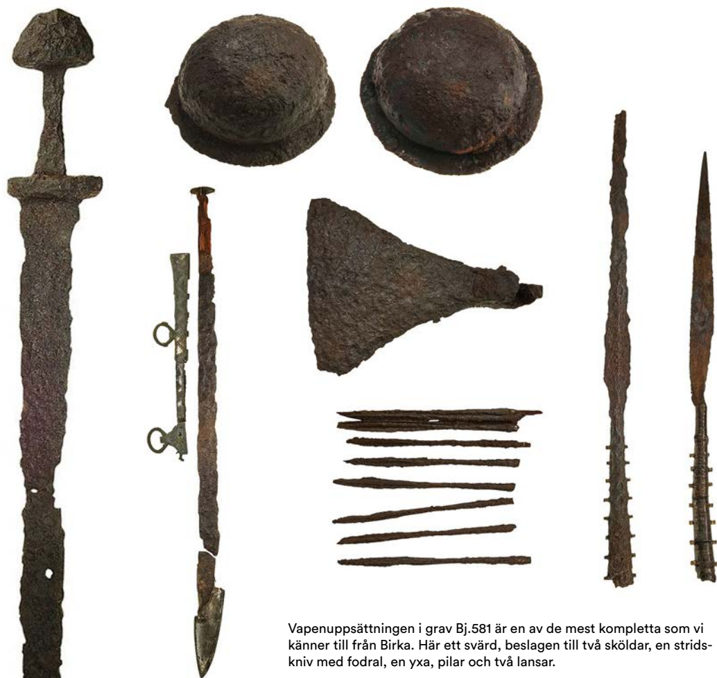
Vapenuppsättningen i grav Bj.581 är en av de mest kompletta som vi känner till från Birka. Här ett svärd, beslagen till två sköldar, en stridskniv med fodral, en yxa, pilar och två lansar.

Dna-proverna visar inte bara att den begravda är kvinna, utan också att hon har ett större släktskap med människor från södra Sverige än från Mälardalen. Strontiumanalysen antyder dessutom att hon har flyttat runt under sin uppväxt. Resultaten kan ses som ett argument för att kvinnan tillhörde samhällets elit, som var mer rörlig än den breda folkmassan. Å andra sidan hämtades även trälarna vanligen utanför det egna området.