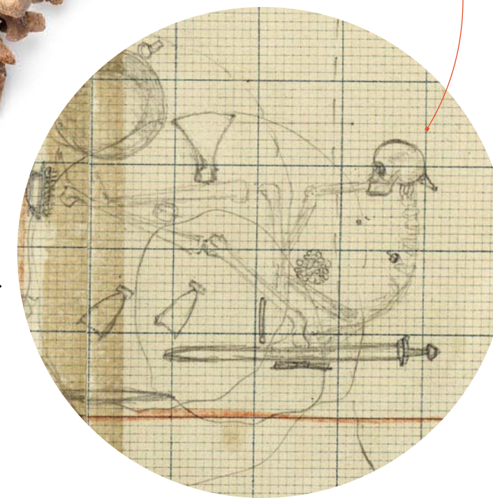
Hjalmar Stolpes ursprungliga teckning av grav Bj. 581 gjordes redan i fält under utgrävningen år 1878.