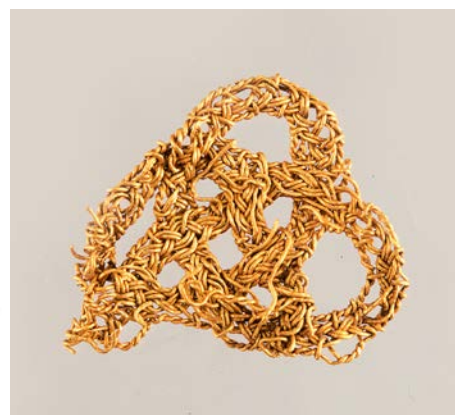
En så kallad posamentknot i form av en kringla, troligen del av brodyr på en tunika.