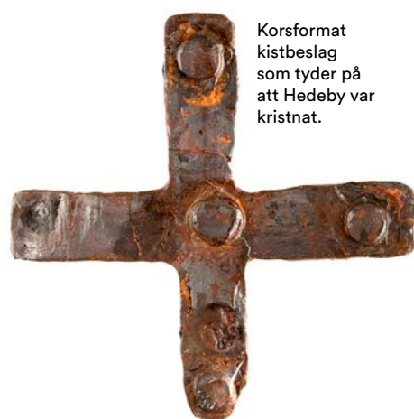
Korsformat kistbeslag som tyder på att Hedeby var kristnat.