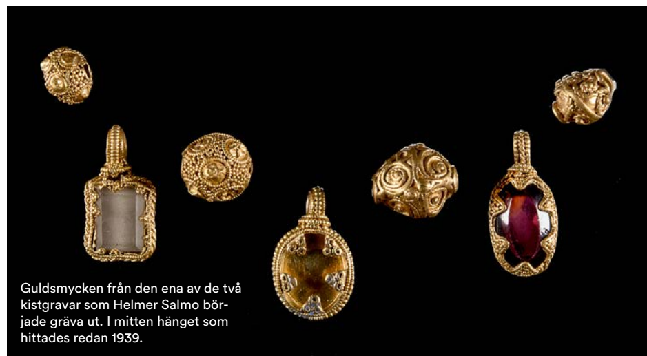
Guldsmycken från den ena av de två kistgravar som Helmer Salmo började gräva ut. I mitten hängset som hittades redan 1939.

– Under hela vikingatiden hade kungarna stort behov av att få in värdefulla föremål. Det kunde de få genom att handla med By-