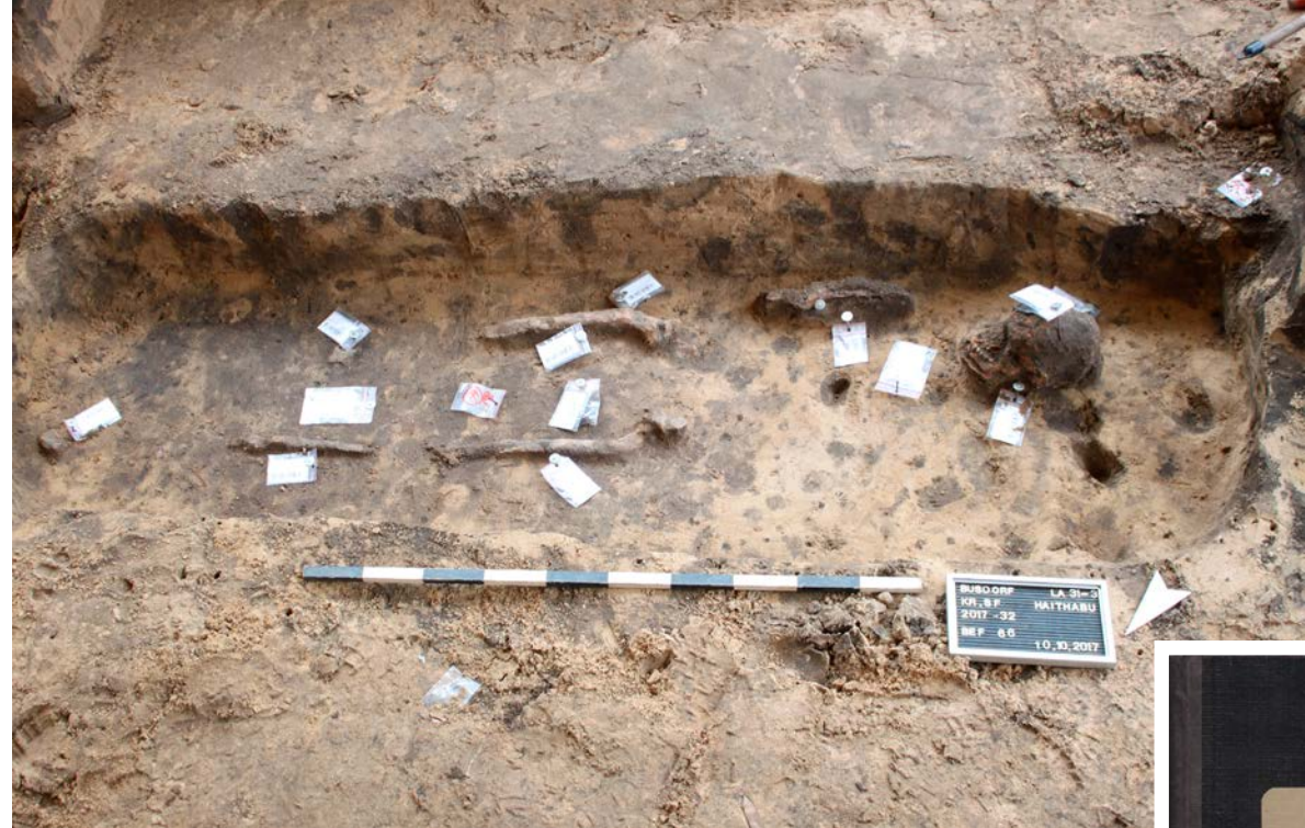
En välbevarad skelettgrav, som låg i ett område som grävdes ut på 1900-talet.