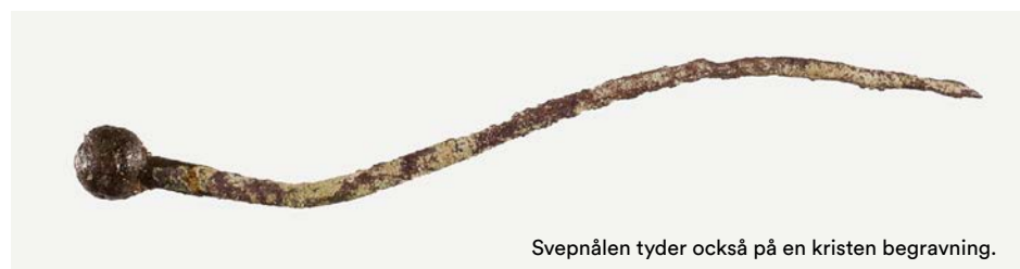
Svepnålen tyder också på en kristen begravning.