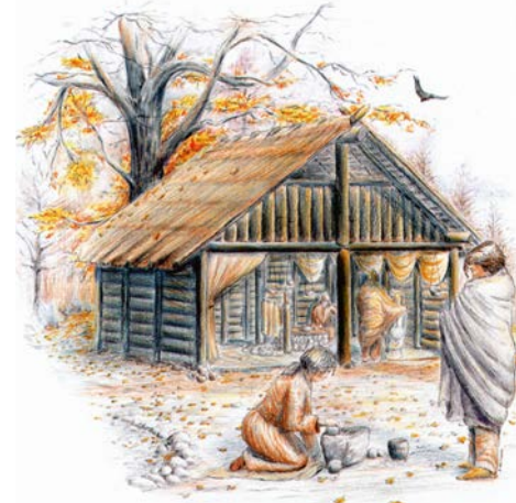
Rekonstruktion av kulthuset i Ringeby i Östergötland. Som ett av de först upptäckta bronsåldershusen ledde Ringeby till upptäckten av fler kulthus.

De isländska fynd som i början av 1900-talet hade tolkats som sådana byggnader var rester efter stora festmåltider och gillen, menade han, och sagornas hof , goðahús och blóthús var bara speglingar av