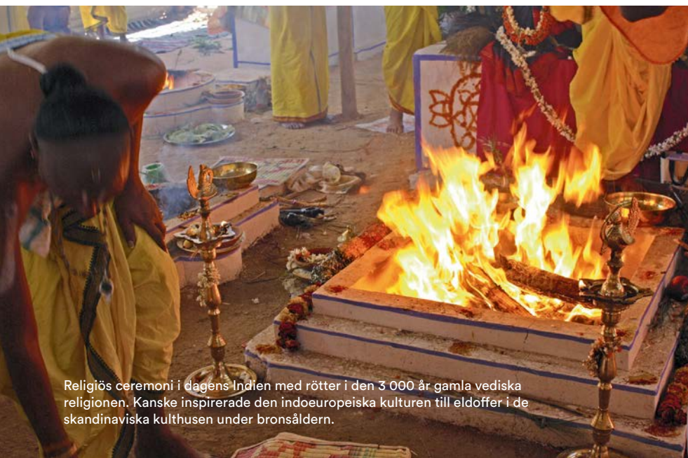
Religiös ceremoni i dagens Indien med rötter i den 3 000 år gamla vediska religionen. Kanske inspirerade den indoeuropeiska kulturen till eldoffer i de skandinaviska kulthuset under bronsåldern.