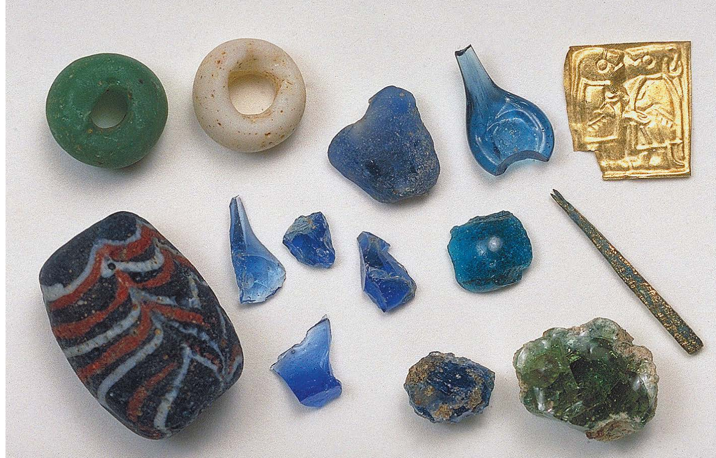
Fynd från hallbyggnaden vid Slöinge söder om Falkenberg i Halland. Överst till höger en guldgubbe.

Samtidigt har arkeologer de senaste åren